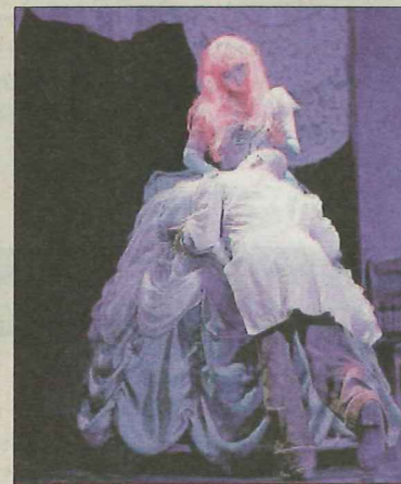
Le mystique est à l'honneur dans la nouvelle production du cirque Starlight, Balchimère . Un nom qui inspire à la fois l'ambiance délicate et gracieuse du bal et l'esprit chimérique et illusoire d'un monde parfait.