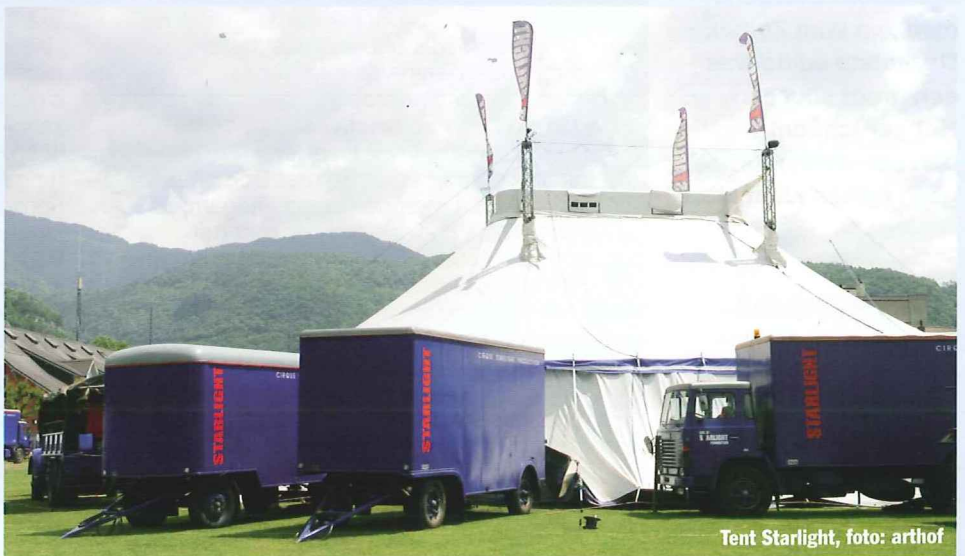
Tent Starlight

Het geheel is vooral doorlopend groeps-werk en geeft conform de titel een aparte mysterieuze sfeer die eigenlijk zowel een kind als volwassen publiek aanspreekt. Balchimère legt Starlight dan ook geen windeieren en de publieksfeedback in Genève was ondersteunend en lovend. In de voorstelling die wij bezochten in Laufen was het publiek wild enthousiast bij de finale die op zijn beurt knap is geregisseerd. ○